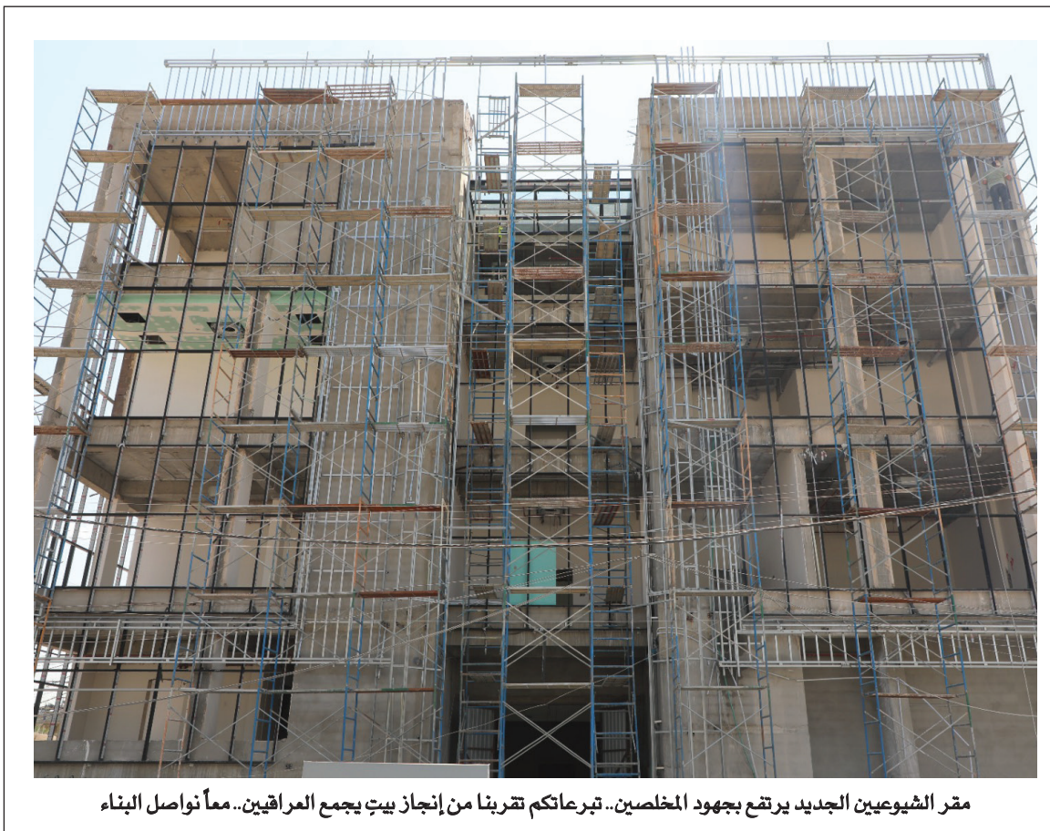
ممر الشيوعيين الجديد يرتفع بجهود المخلصين.. تبرعاتكم تقربنا من إنجاز بيت يجمع العراقيين.. معا نواصل البناء

إن الحاجة إلى جبهة شعبية واسعة لا تتبع من رغبة تنظيمية مجردة، إنما تفرضها طبيعة الصراع الجاري نفسه. فالقوى الديمقراطية والوطنية واليسارية على وجه الخصوص تواجه منظومة متشابكة من السلطة والمال والسلاح والإعلام والتدخلات الخارجية، تمتلك إمكانات كبيرة للتأثير في الوعي العام، وتستخدم الطائفية والزبائنية والإفقار والقمع والتهريب الناعم