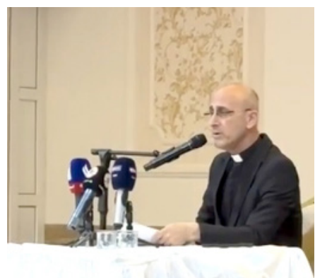
متابعة - طريق الشعب

تداولت صفحات على مواقع التواصل الاجتماعي خلال الأيام الماضية مقطع فيديو لرجل ستيبي بسيط، بدا يلامح أنهبها الشعب وسنوات الكدح، وهو يطلق كلمات غاضبة بعد الكشف عن قضايا فساد وضبط مبالغ طائلة ومجوهرات ثمينة بحوزة مسؤولين، في ما أطلق عليه "صولة الفجر". ولم يكن الكادح يحمل خطاباً سياسياً أو يتحدث بلغة النخب، بل بلهجة الشارع، مستحضراً تفاصيل حياة يومية يتقلها الفقر والغلاء المعيشي، وفي وقت تتكشف فيه بين الحين والآخر ملفات تتعلق بثروات هائلة جُمعت من المال العام. وفي المقطع، خاطب الرجل الفاسدين بعبارة حادة صارخاً: "جوعتونا... ذليتونا... طُحنتوا حظنا"، قبل أن يلتفت إلى المواطنين مُطالباً بإباهم بعدم الصمت على الفساد. إذ ويختم بالقول: ما تتورون على الظالم؟ مالٌ من سرق؟ مالٌ ومال أطفالك... ليش نايم؟! ولم يتوقف عند انتقاد المسؤولين، إنما انتقد أيضاً