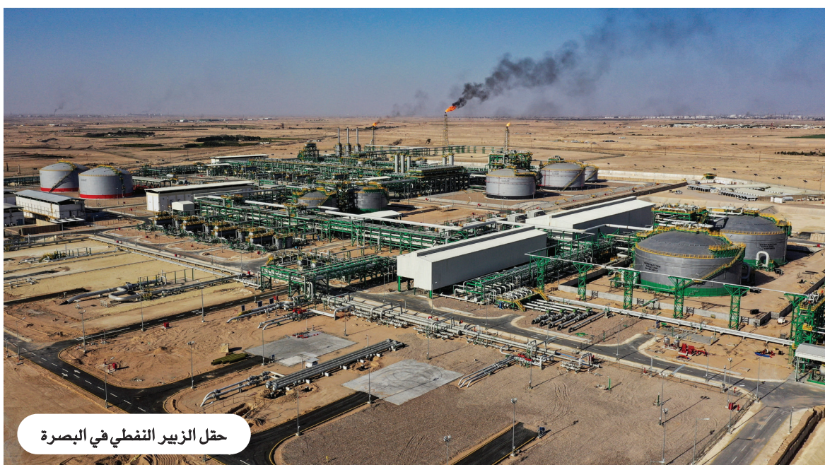
حقل الزبير النفطي في البصرة

وفي ما يتعلق بحصة العراق في منظمة أوبك، توقع الجواهري أن يعاد النظر فيها خلال الاجتماع المقبل للمنظمة، لافتاً إلى إمكانية رفع سقف إنتاج العراق من نحو 4.7 ملايين برميل يومياً إلى خمسة أو خمسة ملايين ونصف، وربما ستة ملايين برميل يومياً، بما ينسجم مع قدراته الإنتاجية واحتياطياته النفطية الكبيرة. وأشار إلى أن زيادة الحصص تمثل فرصة اقتصادية