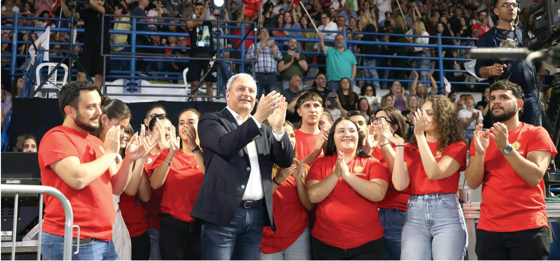
امين عام حزب (أكيل) ستيفانوس ستيفانوف في حفل جماهيري عشية الانتخابات

هل يشترط أن يأتي أي مرشح لرئاسة مجلس النواب من ما يُعرف بكتلة المعارضة في البرلمان؟ لم نضع شروطاً محددة. وقد أوضنا منذ البداية أننا بالتأكيد لن نجري أي حوار مع اليمين المتطرف، وهذا موقف مبدئي بالنسبة لنا. أما فيما يتعلق بحزب التجمع الديمقراطي («ديزي» اليميني) فلا توجد مساحة موضوعية للتوصل إلى اتفاق معه بسبب الخلافات الجوهرية بيننا، سواء على المستوى الأيديولوجي أو السياسي. كما أنه يمثل القطب السياسي المقابل في المشهد السياسي القبرصي. لقد أجرينا بالفعل اتصالات مع أطراف أخرى، وسنواصل هذه المناقشات حتى نتخذ قراراتنا.