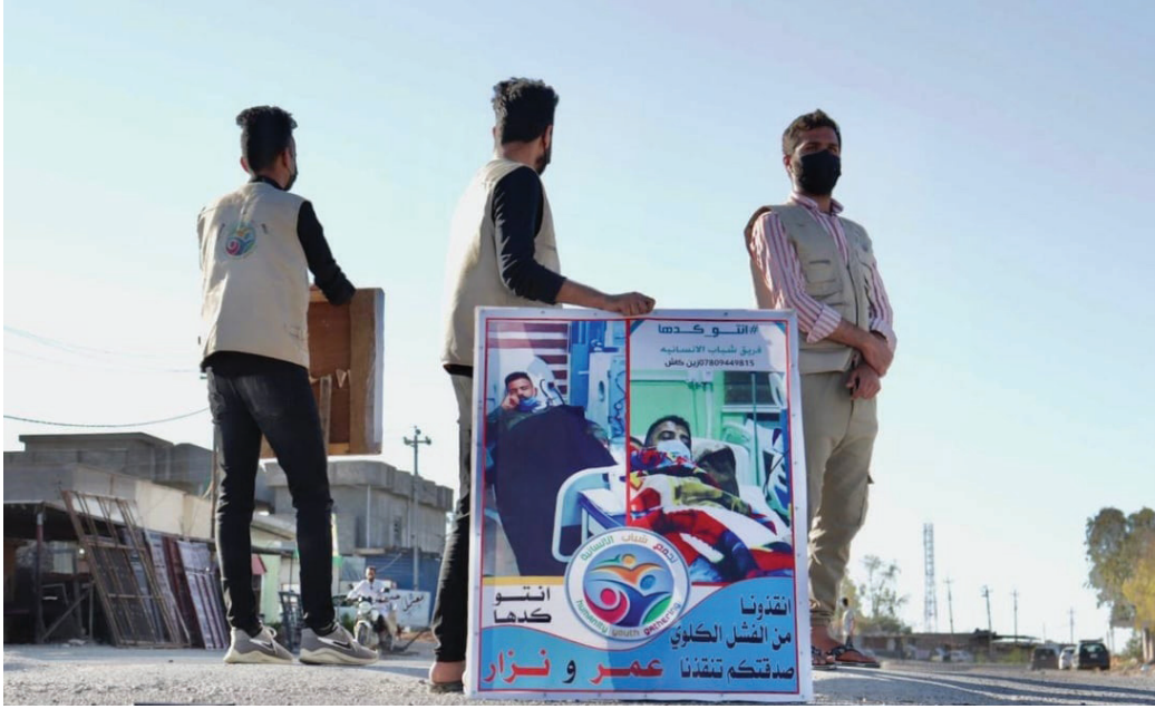
مطلعون يجمعون تبرعات لمعالجة المرضى الفقراء في محافظة الأنبار

ورغم الجدل الذي يرافق هذا النوع من العمل أحيانا، سواء من حيث الشفافية أم الاستمرارية، إلا أنه يبقى حاضرا بوصفه استجابة مباشرة لاحتياجات ملحة، في بيئة تتسم بتزايد الطلب على الدعم الطبي والمعيشي. وفي المحصلة، يعكس هذا النمط من المبادرات واقعا إنسانيا معقدا. حيث تتداخل الجهود الفردية مع محدودية التمويل، في محاولة مستمرة لسد فجوات كبيرة في منظومة الرعاية والدعم الاجتماعي.