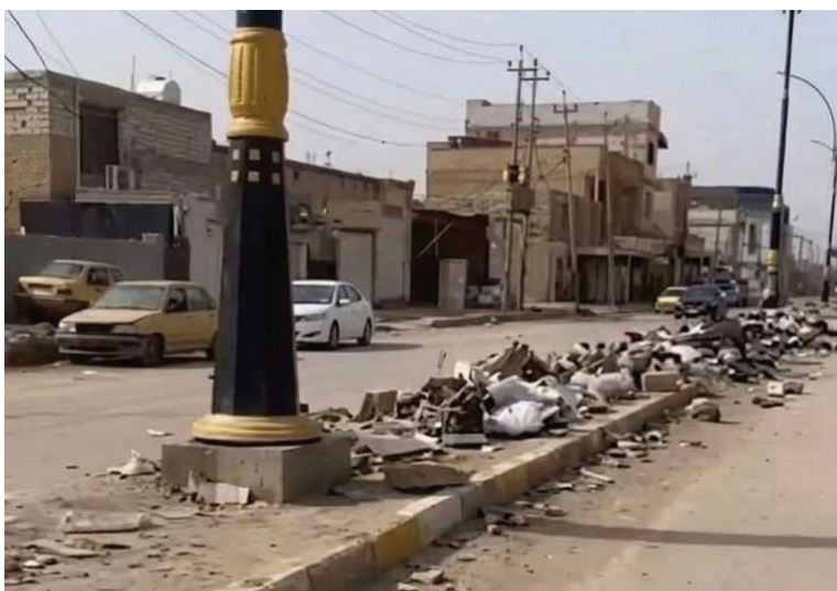
تراكم النفايات والأنقاض على الأرصفة والجزرات الوسطية، مشهد مألوف في مدينة الديوانية، في ظل إهمال خدمي كبير