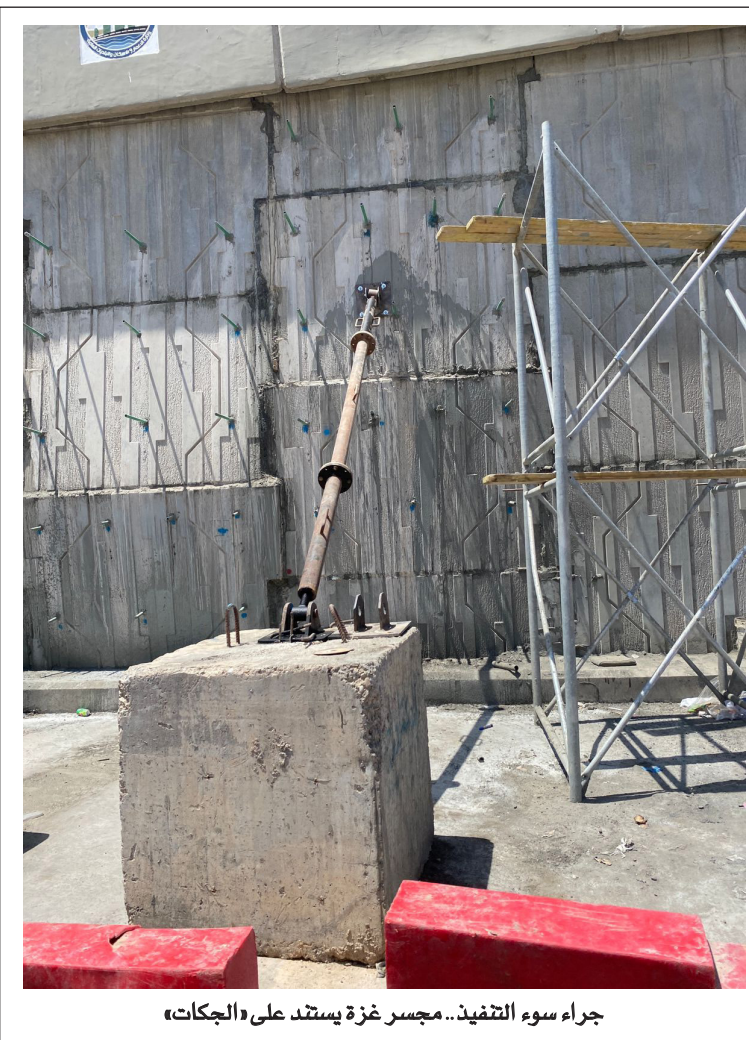
جراء سوء التنفيذ.. مجسر غزة يستند على «الجكات»

مطالبات بتوفير السكن شهدت محافظة واسط تظاهرة لعدد