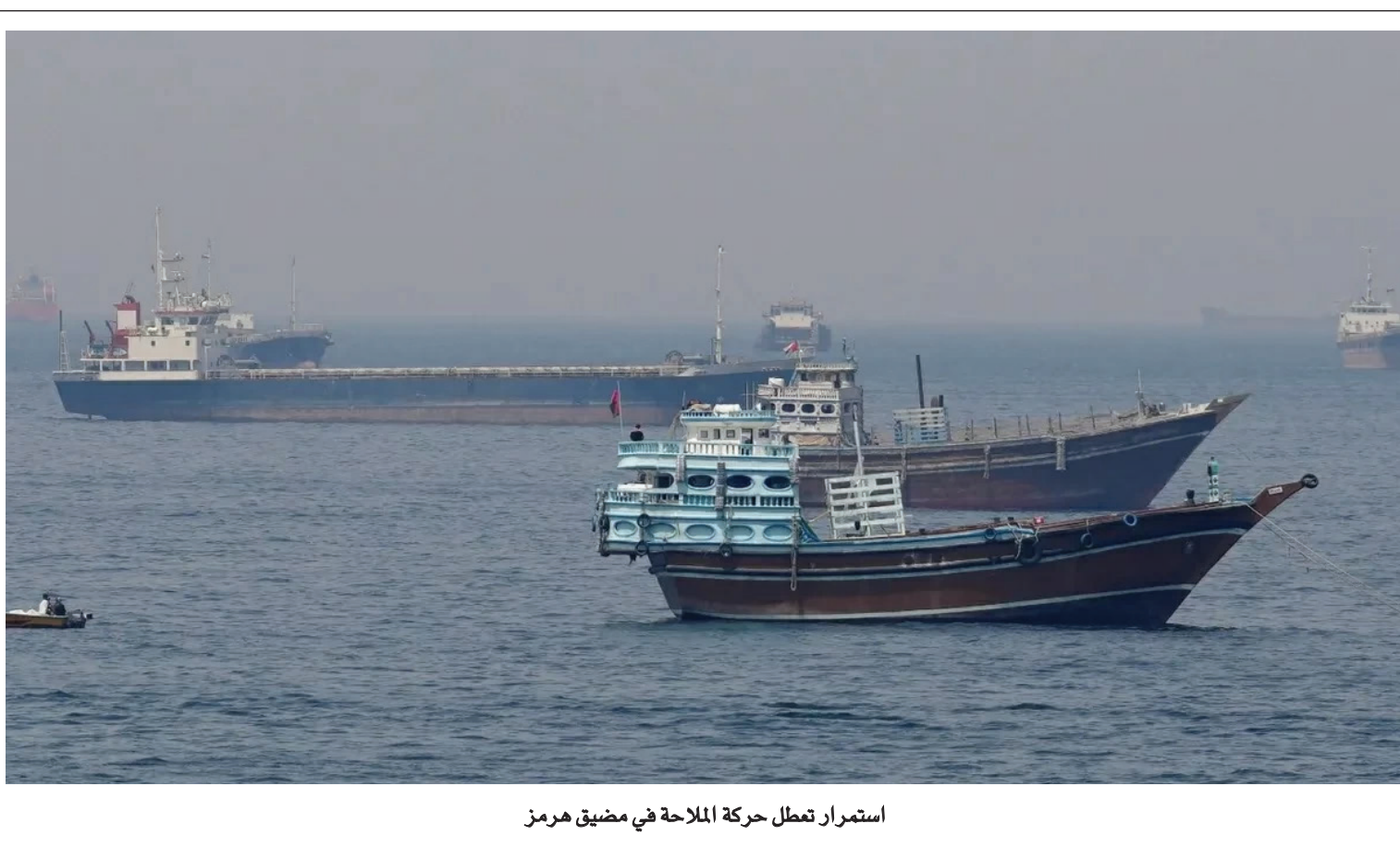
استمرار تعطيل حركة الملاحة في مضيق هرمز