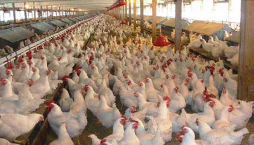
أصحاب دواجن: اين ادعاء الحكومة دعم المنتج المحلي؟

وبخصوص تأثر اصحاب المشاريع بقرار وزارة الزراعة، يؤكد يوسف ”هناك مشاريع تنتج مئات العلب من البيض، لذلك من غير المعقول ان تستهلك المحافظة هذه الكميات يوميا من البيض“، محذرا من ”أننا مقلبون على ازمة غذائية، لاسيما في ظل ارتفاع سعر طن العلف الى 700 دولار، لذا فمن الطبيعي أن يرتفع سعر البيض بسبب ارتفاع كلفة الانتاج“.