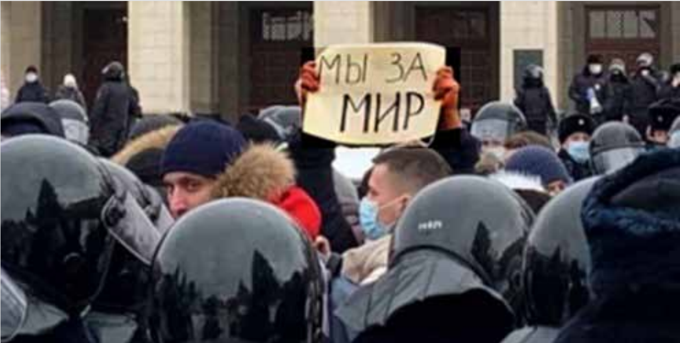
جانب من الحركة المناهضة للحرب في روسيا

بالإضافة إلى الاحتجاج على الحرب والمطالبة بالانسحاب الفوري للقوات من أوكرانيا، تجري محاولة تجميع اليسار الروسي المختلف بشأن مسألة السلام. وناشدت هذه الحركة، في نداء، الحزب الشيوعي الروسي وحلفاءه في إطار تكتل "اليسار الوطني" أن ينشطوا ضد سياسة دعم الحكومة التي تتبناها قيادة الحزب وكتلته البرلمانية. وفي تطور لفت تبنى 3 نواب شيوعيين مواقف داخل البرلمان تتعارض مع الموقف الرسمي، الذي يتبناه الحزب الشيوعي في روسيا الاتحادية بشأن الحرب المستمرة في أوكرانيا.